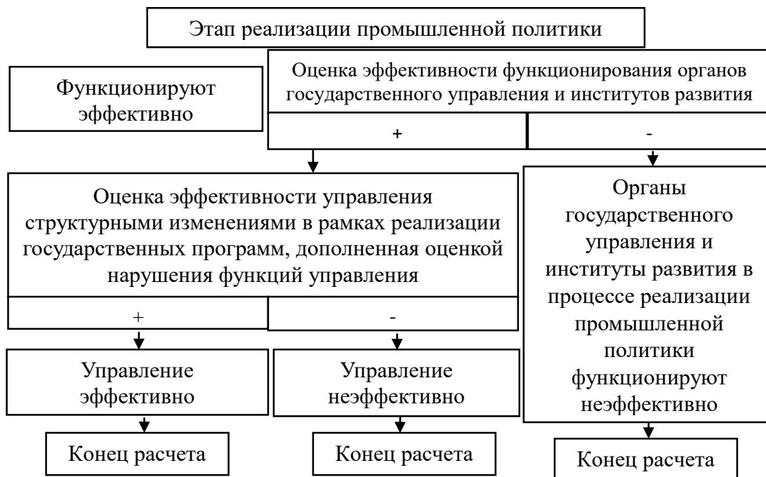
Рисунок 3. Алгоритм оценки эффективности управления структурными изменениями на этапе реализации структурной промышленной политики (сост. автором).

На этапе реализации структурной промышленной политики предлагается оценивать эффективность функционирования органов государственного управления и институтов развития, а также эффективность и нарушение функций управления структурными изменениями в рамках реализации государственных программ (Рисунок 3).